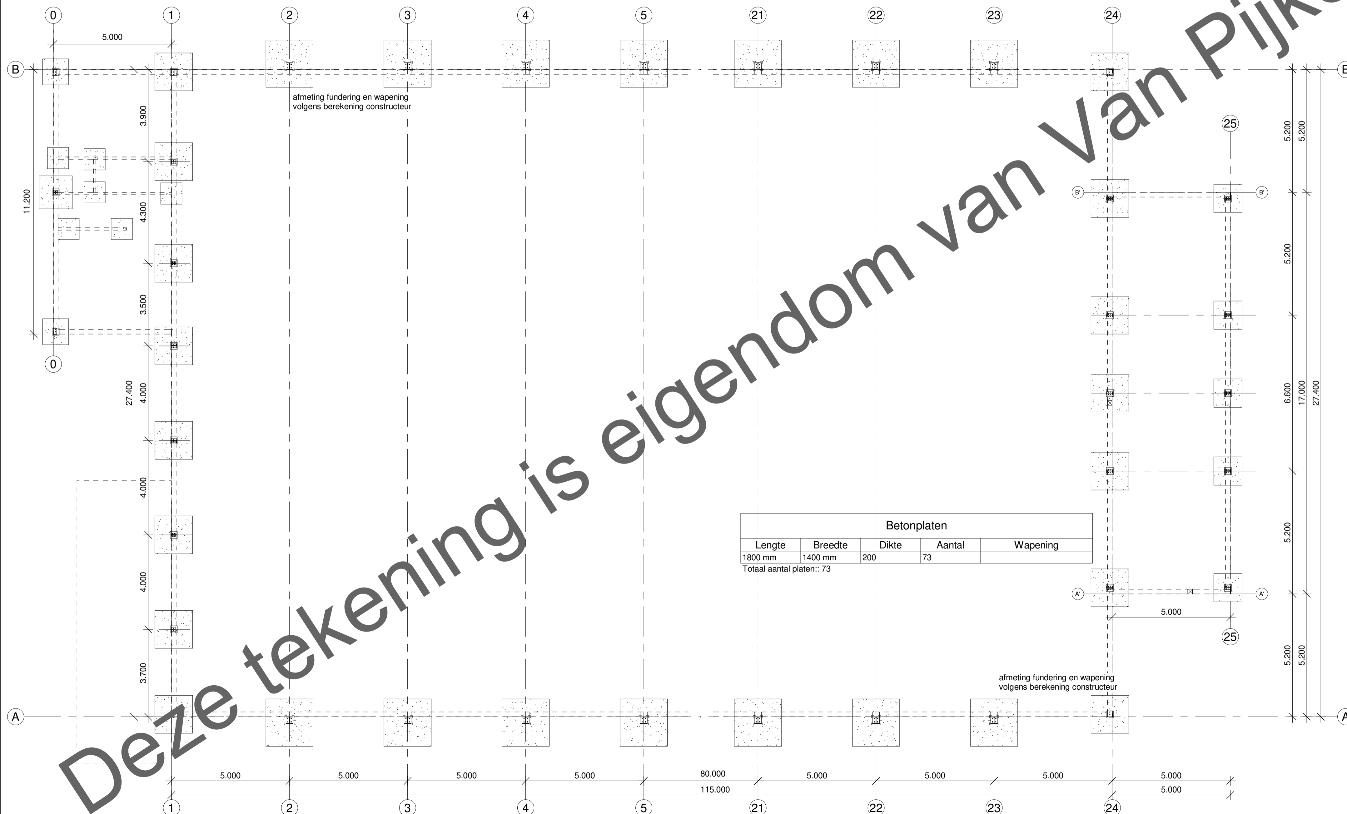
Fundering 1 : 100